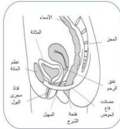
الشكل 2: قاع الحوض